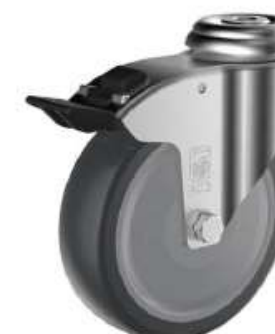
Roulette Pivotante à Frein à Oeil en Caoutchouc Gris