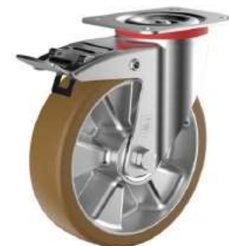
Roulette Pivotante à Frein Avant en Aluminium / Polyuréthane