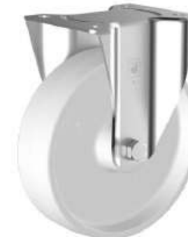
Roulette Fixe en Polyamide