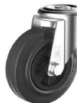
Roulette Pivotante à Oeil en Caoutchouc Noir