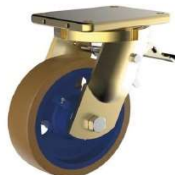
Roulette Pivotante à Frein Arrière en Fonte / Polyuréthane