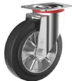
Roulette Pivotante en Aluminium / Caoutchouc